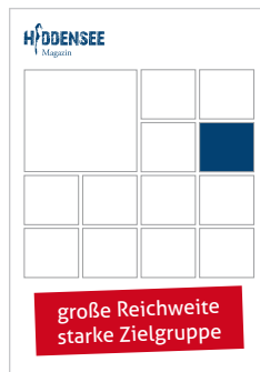
Online-Portal 100,- Euro/Monat Schnupperpreis